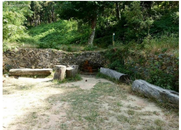
Font del Ferro