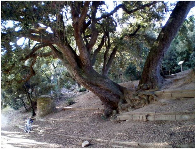
Alzina can Ferrerons