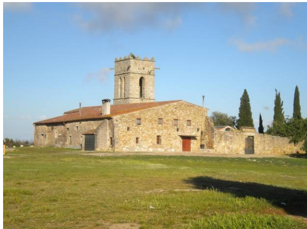
Santuari del Corredor