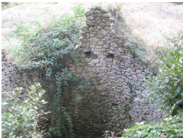
Pou de glaç