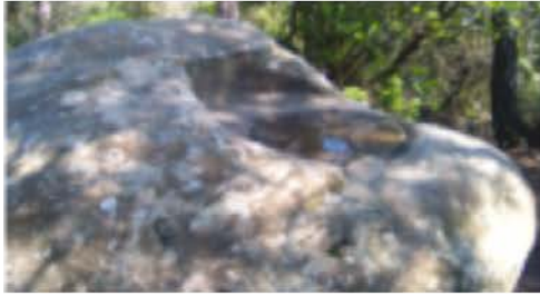
Plat del molí