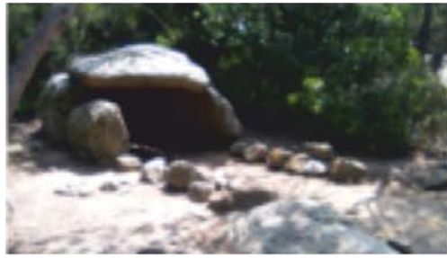
Dolmen de Céllecs o Cabana del Moro