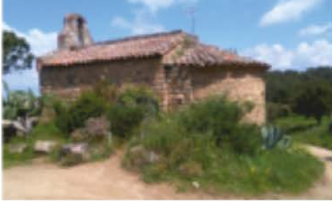
Ermita de Sant Bartomeu