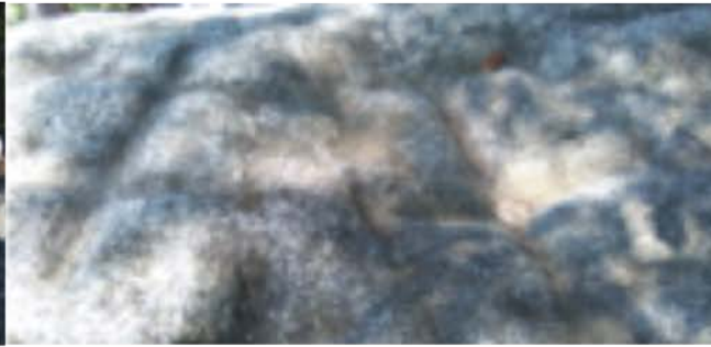
Pedra de les creus