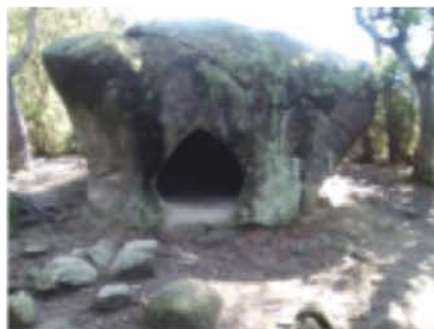
Roca Foradada de Can Gol