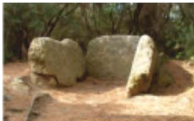
Dolmen de Can Gol