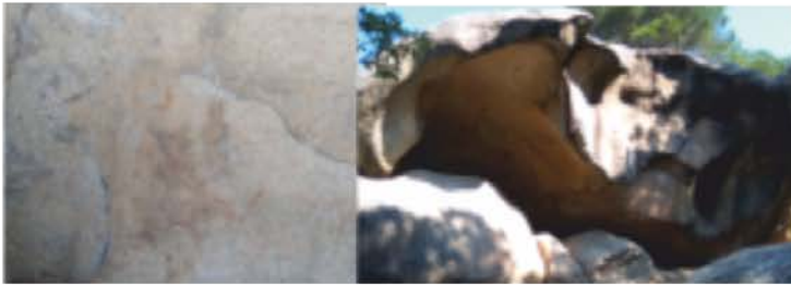
Pedra de les orenetes